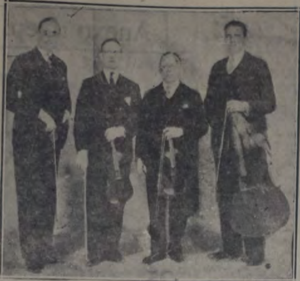
CUARTETO DE LONDRES